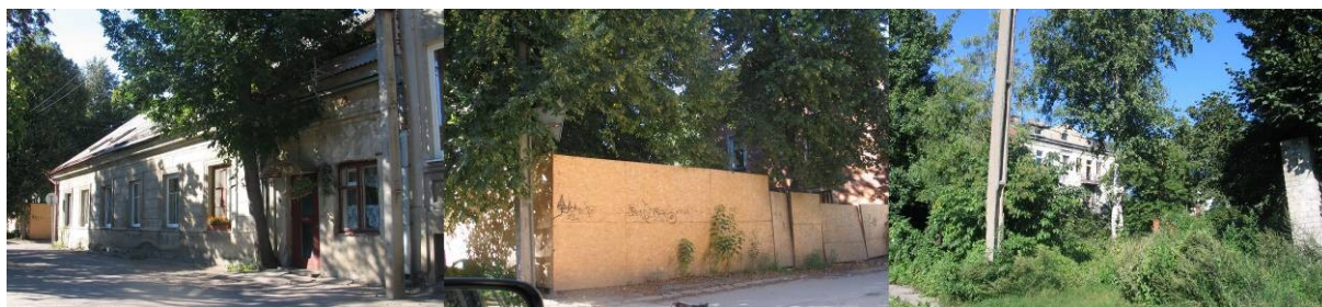
Pav. 14. Vaizdai nuo Druskininkų ir Kurpių g. sankryžos.

BP šie žemės sklypai turi sodybinio užstatymo gyvenamosios teritorijos , paskirtį. Dėl tų pačių priežasčių kaip ir aukščiau aprašyto planuojamo pakeitimo atveju, ruošiamasi šios teritorijos paskirtį keisti į mažaaukščių gyvenamųjų namų statybos gyvenamąją teritoriją .