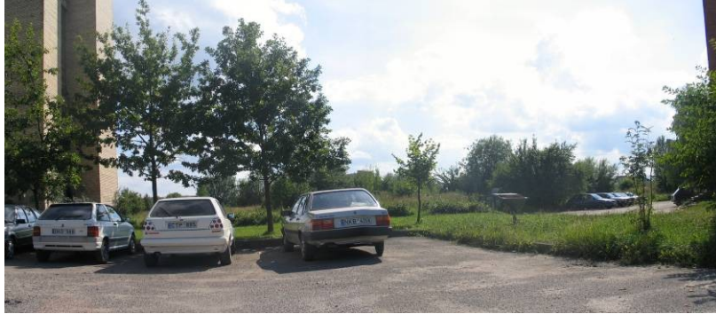
Pav. 31. Vaizdas link Šakenio g.

Bendrajame plane numatyta paskirtis — gyvenamoji teritorija, sodybinio užstatymo . Siūloma ją keisti į gyvenamąją teritoriją (daugiaaukščių ir aukštybinių gyvenamųjų namų statybos) .