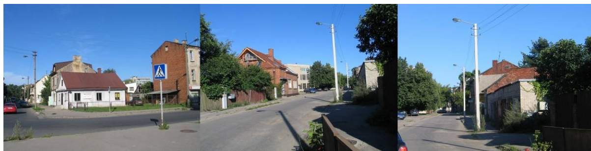
Pav. 21. Vietovės vaizdai nuo Kaunakiemio bei Šiaulių g.

Vietovė yra tarp Karo ligoninės, Apynių ir Kaunakiemio gatvių. Šiaulių g. kertą šią teritoriją skersai. Šiuo metu — tai daugiausiai mažaaukščiais pastatais užstatyta teritorija.