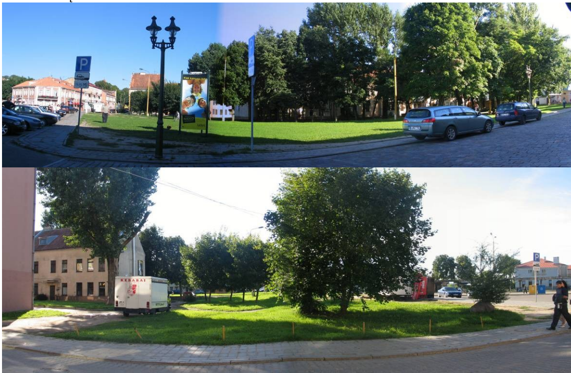
Pav. 15. Pakeitimų Nr. 22 ir 23 vieta. Vaizdas iš M. Valančiaus ir Šv. Gertrūdos g. kampo ir nuo Kumelių g.

Šiuo metu tai vieno Senamiesčio kvartalo dalis, kuri yra apaugusi medžiais ir pagal BP laikoma bendrojo naudojimo želdynų teritorija . Šiaurinę šios teritorijos dalį siūloma keisti į mažaaukščių gyvenamųjų namų statybos gyvenamąją teritoriją ir taip atstatyti Senamiesčio užstatomo struktūrą. Tačiau dabartiniu metu ši teritorija yra naudojama kaip skveras, ir nors jos pietinė dalis turėtų išlikti kaip želdynas, paskirties keitimas gali sulaukti rimtų prieštaravimų.