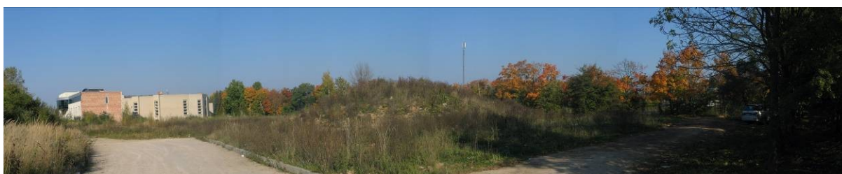
Pav. 44. Vaizdas iš Biržiškų g. pusės.

Bendrajame plane ši teritorija skirta rekreaciniams objektams statyti ir eksploatuoti , siūloma keisti jos paskirtį į gyvenamąją .