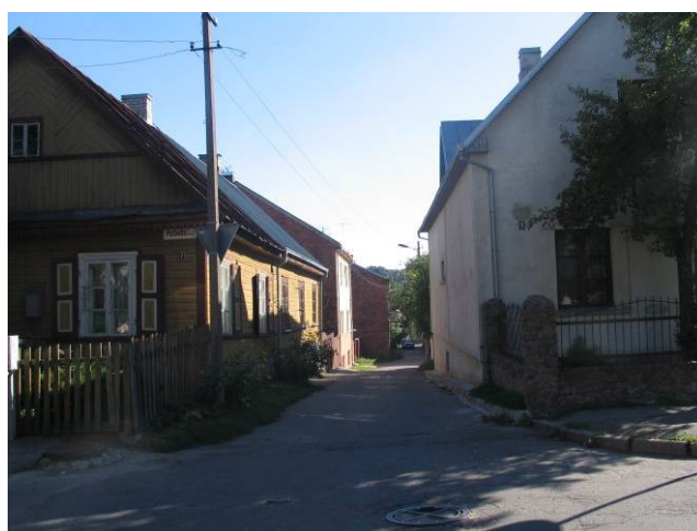
Pav. 17. Trimito g. vaizdas iš D. Poškos g. pusės.