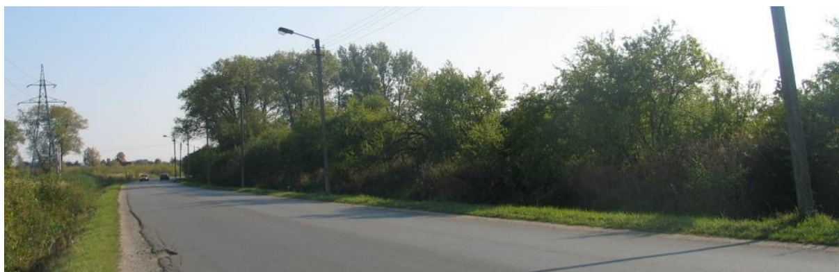
Pav. 7. Teritorijos vaizdas nuo Seniavos pl.

BP — tai bendrojo naudojimo želdynų teritorija. Ji buvo numatyta kaip naujai statomo mažaaukščių gyvenamųjų namų kvartalo žaliasis plotas, įsiterpęs tarp planuojamų komercinės paskirties objektų teritorijų. Šiuo metu visa ši teritorija nėra galutinai įsisavinta. Planuojama keisti šios teritorijos paskirtį į komercinės paskirties objektų bei mažaaukščių gyvenamųjų namų statybos teritorijas. Keitimas nepablogintų esamos padėties, kadangi realiai nei gyvenamasis kvartalas, nei numatytas želdynas nėra įgyvendinti. Tačiau atsiradus suplanuotiems kvartalams, jie neturės artimos bendrojo naudojimo teritorijos