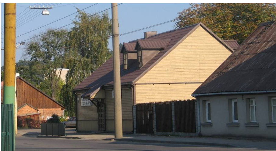
Pav. 36. Pastatas Tylos g. 2 / Vaidoto g. 35.

Bendrajame plane šis sklypas yra gyvenamoji teritorija, sodybinio užstatymo . Siūloma ją pakeisti į komercinės paskirties objektų teritoriją (laidojimo paslaugų statinių statybos) .