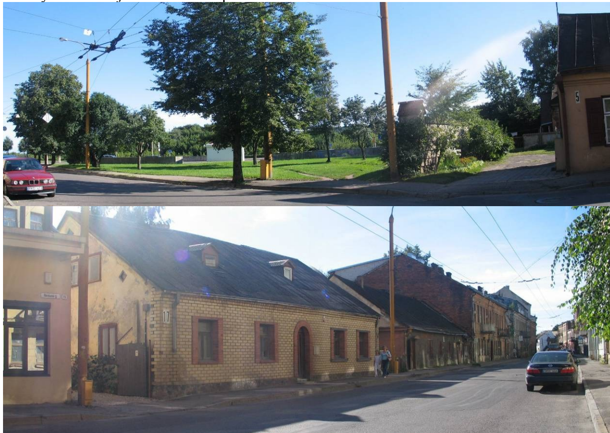
Pav. 13. Vaizdai iš Nemuno g. pusės.

BP sprendiniuose ji įvardinta kaip gyvenamoji teritorija, sodybinio užstatymo . Kauno miesto savivaldybės administracijos specialistų iniciatyva ją siūloma pakeisti į mažaaukščių gyvenamųjų namų statybos gyvenamąją teritoriją , remiantis nuostata, kad sodybinio užstatymo teritorijos urbanistiniu požiūriu nedera miesto centrui.