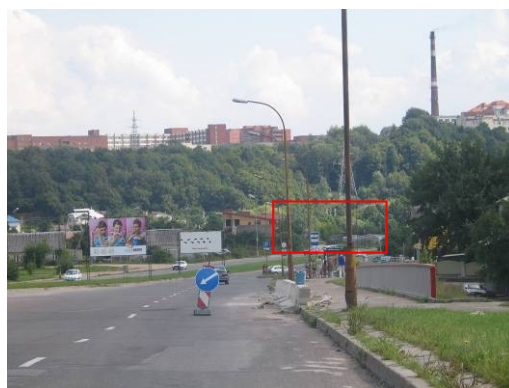
Pav. 25. Vietovės vaizdas, leidžiantis Baltų prospektu.

Sklypas yra nutolęs per apie 95 m nuo Neries upės. Į kultūros paveldo vertybių ribas ar jų apsaugos zonas ši teritorija nepatenka. Dalis šios teritorijos patenka į vandens apsaugos juostą.