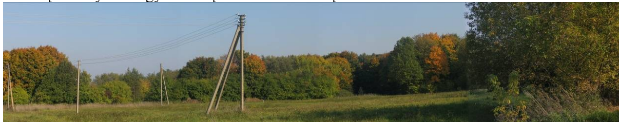
Pav. 40. Vaizdas nuo Piliunos gatvės (dešinėje nuotraukos pusėje) link Kauno marių (karėje pusėje).

Bendrajame plane buvo numatyta bendrojo naudojimo želdynų teritorijos paskirtis , siekiant užtikrinti bent vieną priėjimą prie Kauno marių šioje zonoje. Siūloma keisti paskirtį į gyvenamąją teritoriją (mažaaukščių gyvenamųjų namų statybos) . Pakeitimas beveik visiškai atskirtų Vaišvydavo gyvenvietę nuo Kauno marių.