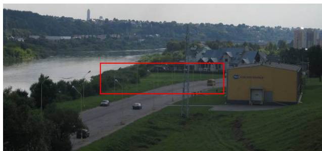
Pav. 39. Vaizdas nuo tilto per Nerį.