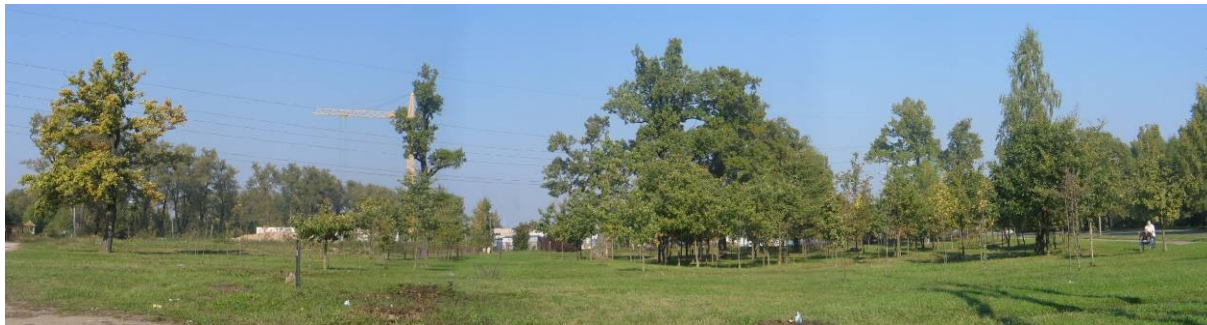
Pav. 22. Vaizdas iš Verkių g. pusės.

Bendrajame plane šis sklypas yra infrastruktūros teritorija , dabar siūloma pakeisti jo paskirtį į komercinės paskirties objektų teritoriją bei į daugiaaukščių ir aukštybinių gyvenamųjų namų statybos gyvenamąją teritoriją .