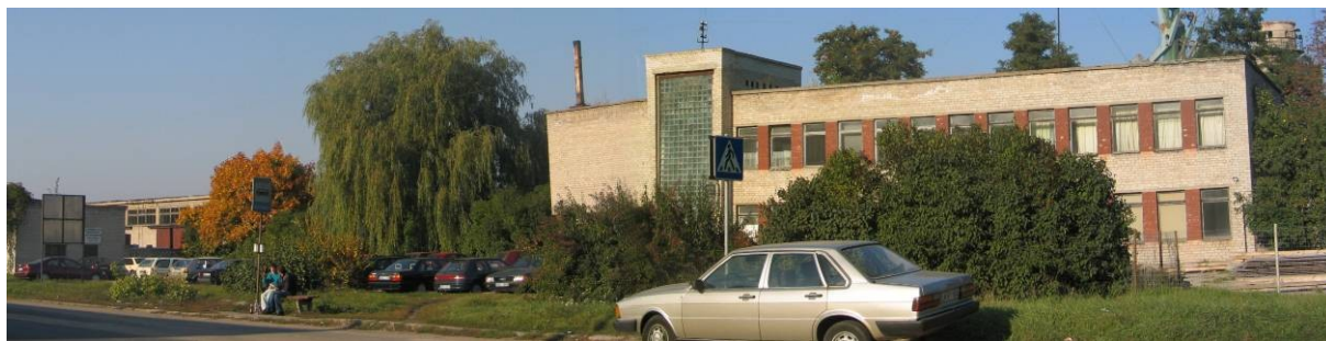
Pav. 42. Vaizdas nuo H. ir O.Minkovskių g. pusės.

Bendrajame plane numatyta paskirtis — komercinės paskirties ir smulkaus verslo objektų teritorija . Siūloma keisti paskirtį į pramonės ir sandėliavimo objektų teritoriją, inžinerinės infrastruktūros teritoriją .