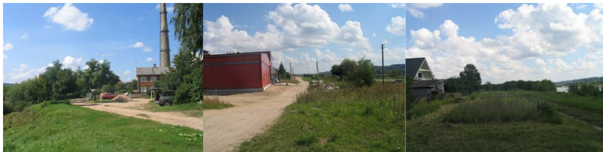
Pav. 26. Vietovės vaizdai nuo Raudondvario 4-ojo tako ir Kulautuvos g.

Dalyje šios teritorijos, kuri ribojasi su užstatyta šio Vilijampolės kvartalo dalimi siūloma nutiesti gatvę, kuri įgytų inžinerinės infrastruktūros teritorijos paskirtį .