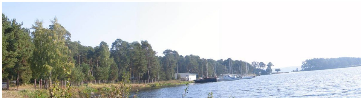
Pav. 29. Pusiasalio vakarinis krantas.