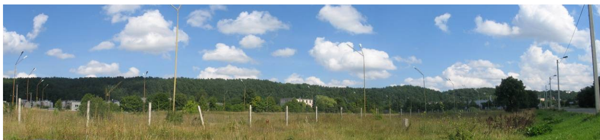
Pav. 37. Vaizdas nuo Raudondvario pl. pusės.

Bendrajame plane — tai naudingųjų iškasenų teritorija , kurią siūloma keisti į komercinės paskirties objektų teritoriją bei gyvenamąją teritoriją .