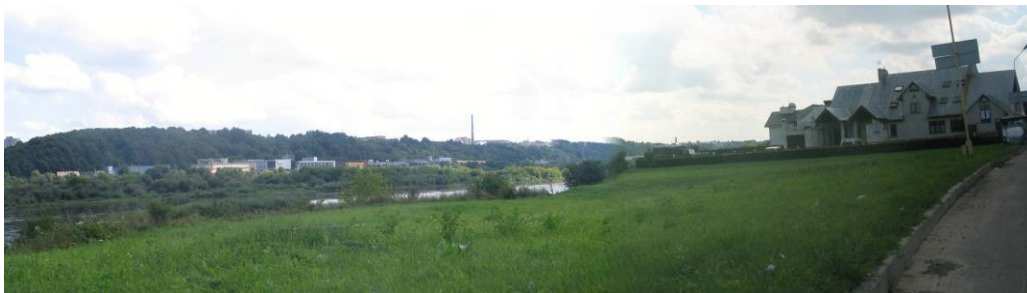
Pav. 38. Vaizdas iš Panerių g.

Bendrajame plane — tai bendrojo naudojimo želdynų teritorija . Ją siūloma keisti į gyvenamąją teritoriją (mažaaukščių gyvenamųjų namų statybos) . Teritorija yra šalia judrios gatvės ir svarbios sankryžos, tai daro ją nelabai tinkamą keisti į gyvenamąją teritoriją.