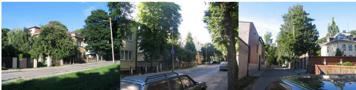
Pav. 23. Nagrinėjama vietovė iš Totorių, Trakų bei Krėvos gatvių pusės.

Bendrajame plane dalis sklypų yra įvardinti kaip sodybinio užstatymo gyvenamoji teritorija . Miesto savivaldybės administracijos specialistai siūlo pakeisti paskirtį į gyvenamąją teritoriją (mažaukščių gyvenamųjų namų statybos) .