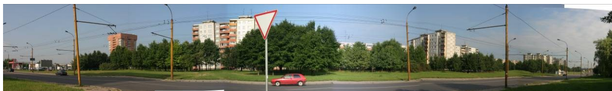
Pav. 5. S. Žukausko g. vakarinė pusė nuo sankryžos su V. Ramanausko – Vanago g.

BP ši teritorija įvardinta kaip bendrojo naudojimo želdynų teritorija . Planuojamas pakeitimas į komercinės paskirties objektų teritoriją . Žemė šioje vietoje buvo sugražinta savininkams ir yra privati. Šioje vietoje kyla konfliktinė situacija tarp Eigulių rajono S. Žukausko g. gyventojų bei žemės savininkų. Dabartiniu metu ši apželdinta teritorija skiria daugiabučius nuo S. Žukausko g. Pakeitus jos paskirtį ir užstačius komercinės paskirties pastatais, bus sutankintas šio kvartalo užstatymas.