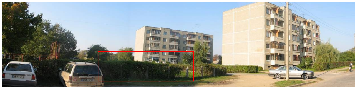
Pav. 9. Vietovės vaizdas nuo Antanavos g. pusės.