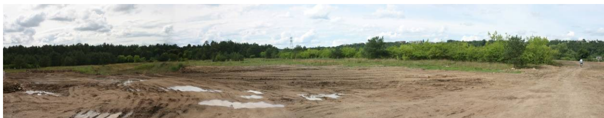
Pav. 2. Teritorija į vakarus nuo Viešios g.