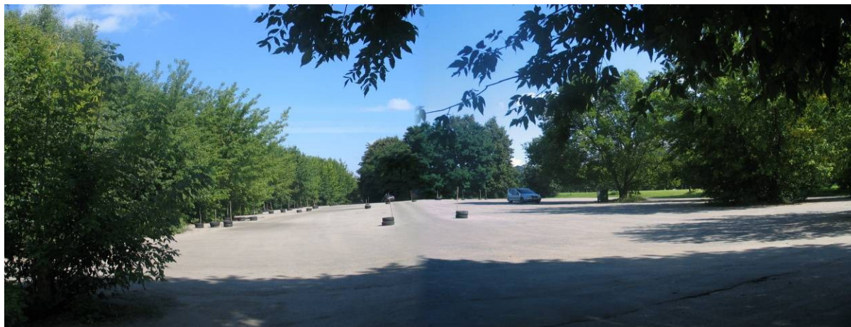
Pav. 27. Jonavos g. 7 vaizdas.

Bendrajame plane šis sklypas yra infrastruktūros teritorija , siūloma pakeisti jo paskirtį į komercinės paskirties objektų teritoriją .