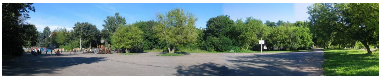
Pav. 19. Vietovės vaizdas nuo Priekplaukos krantinės g.