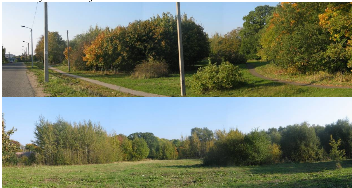
Pav. 10. Sklypo vaizdai nuo S.Dariaus ir S.Girėno. bei A. Gustaičio gatvių

Šis žemės sklypas BP įvardintas kaip bendrojo naudojimo želdynų teritorija , tačiau jis priklauso VDU. Planuojama pakeisti šio sklypo paskirtį į visuomeninės paskirties teritoriją ir naudoti Vytauto Didžiojo universiteto reikmėms.