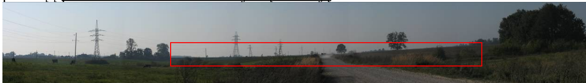
Pav. 43. Teritorijos vaizdas nuo Armoniškių g.

Bendrajame plane numatyta paskirtis — bendrojo naudojimo želdynų teritorija . Numatyta kurti naujo gyvenamojo kvartalo želdyną, kurio teritoriją teka upė Marvelė. Šiuo metu bendrojo plano sprendiniai čia dar nepradėti įgyvendinti. Dalyje šios teritorijos siūloma keisti paskirtį į pramonės ir sandėliavimo objektų teritoriją .