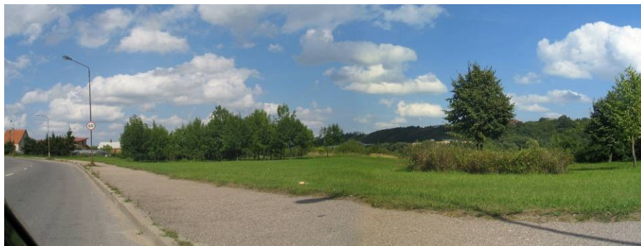
Pav. 24. Vietovės vaizdas nuo Neries krantinės gatvės.

Vietovė yra netoli Neries upės, tarp Neries krantinės ir Plungės gatvių. Šiuo metu tai želdiniais apaugusi pakrantė šalia gyvenamųjų namų kvartalo.