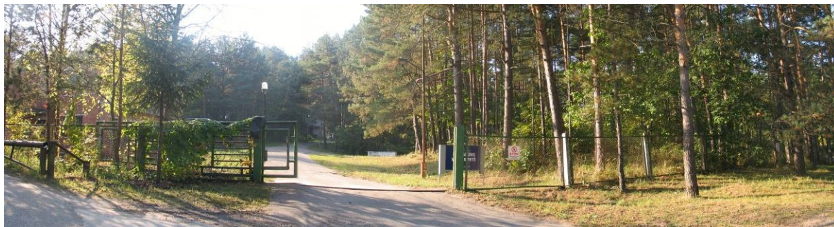
Pav. 28. Įvažiavimas į Petrašiūnų vandenvietės teritoriją.

Kadangi ši teritorija yra regioniniame parke, o taip pat patenka į kelių skirtingo pobūdžio apsaugos zonų ribas, bendrojo plano keitimas kelia daug problemų. Taip pat keitimui šioje vietoje turi įtakos 2005–07–14 LR Vyriausybės nutarimas Nr. 1154 dėl valstybinės reikšmės miškų plotų. Pagal šį nutarimą, nagrinėjama teritorija, išskyrus zonas prie esamų pastatų priskirta valstybinės reikšmės miškų plotams. Todėl tikslinga BP koreguoti keičiant paskirtį iš naudingųjų iškasenų teritorijos į miškų ūkio paskirties žemę, Petrašiūnų vandenvietės ribose esančius ne miško plotus palikti naudingųjų iškasenų teritorija, o plotus prie esamų pastatų – į rekreacinės paskirties teritorijas.