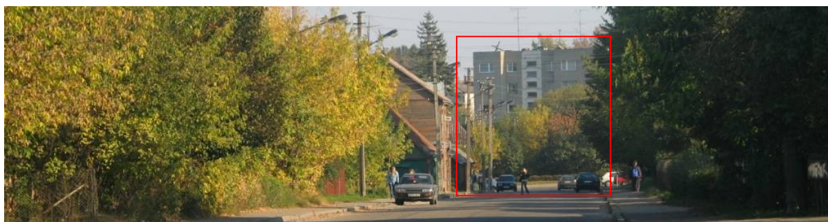
Pav. 8. S.Dariaus ir S.Girėno g. tąsa.

Planuojama gatvė pagerintų susisiekimą šioje Aleksoto dalyje, tačiau jos tiesimas praktiškai sunkiai įgyvendinamas dėl esamo užstatymo.