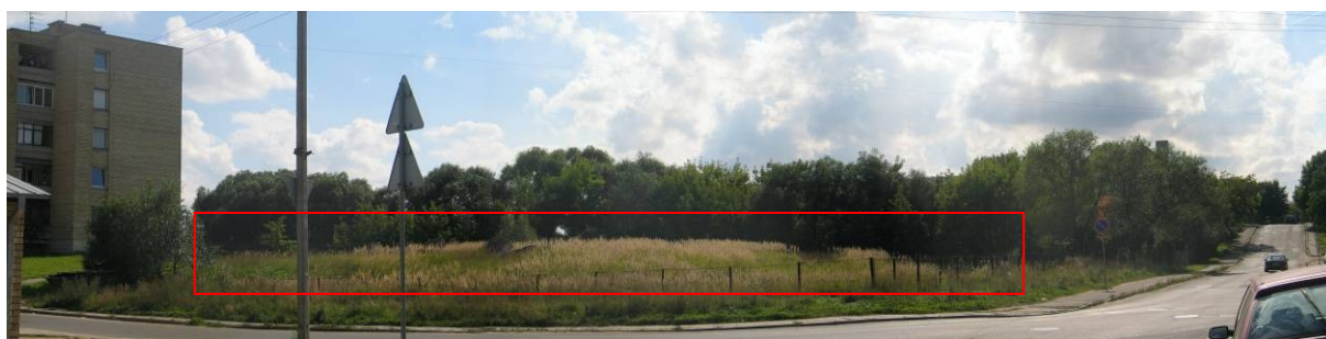
Pav. 6. Rytų g. 6, žiūrint link Gričiupio parko.

BP ši teritorija yra gyvenamoji teritorija, sodybinio užstatymo , o planuojama keisti į daugiaaukščių ir aukštybinių gyvenamųjų namų statybos teritoriją . Šis pakeitimas neturėtų kelti didelių aplinkos kokybės problemų, tačiau vėliau jo pagrindu vykdant žemesnio lygmens planavimo darbus svarbu išlaikyti prieigą prie Gričiupio parko iš Rytų arba Saulės g. pusės.