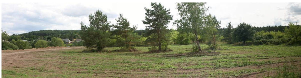
Pav. 3. Viešios g. pabaiga netoli Neries, žiūrint į Klebonišio g. pusę.