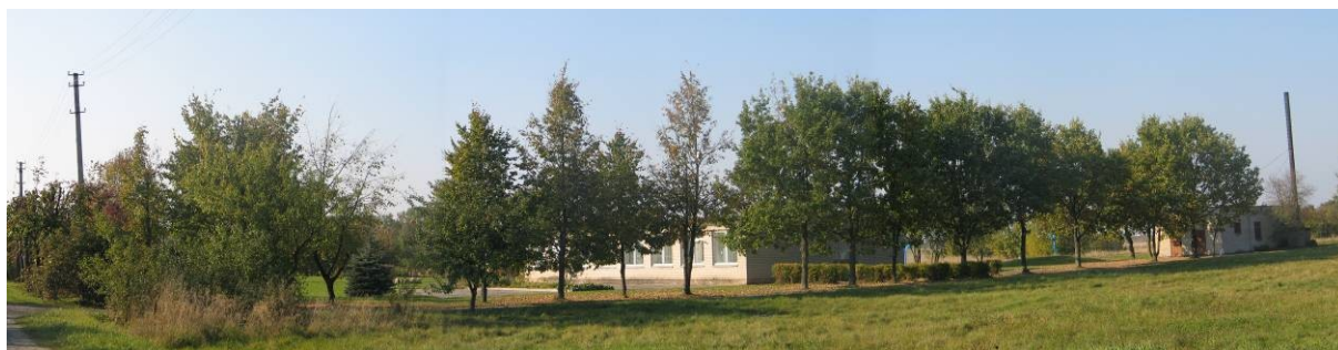
Pav. 12. Kazliškių pradinė mokykla.

BP ši teritorija buvo įvardinta kaip gyvenamoji , tačiau čia įsikūrusi Kazliškių pradinė mokykla. Todėl šio sklypo paskirtis keičiama į visuomeninės paskirties teritoriją (mokslo ir mokymo, kultūros ir sporto, sveikatos apaugos pastatų bei statinių statybos).