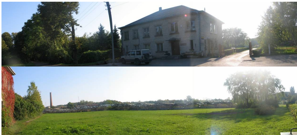
Pav. 41. Vaizdas nuo Antakalnio g.

Bendrajame plane numatyta paskirtis — sodybinio užstatymo gyvenamoji teritorija, visuomeninė teritorija . Siūloma ją keisti į gyvenamąją teritoriją (daugiaaukščių ir aukštybinių gyvenamųjų namų statybos) .