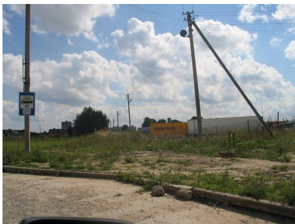
Pav. 34. 9-ojo Forto g. 58 vaizdas.

Bendrajame plane numatyta paskirtis — gyvenamoji teritorija, sodybinio užstatymo , o ją siūloma keisti į gyvenamąją teritoriją (daugiaaukščių ir aukštybinių gyvenamųjų namų statybos) .