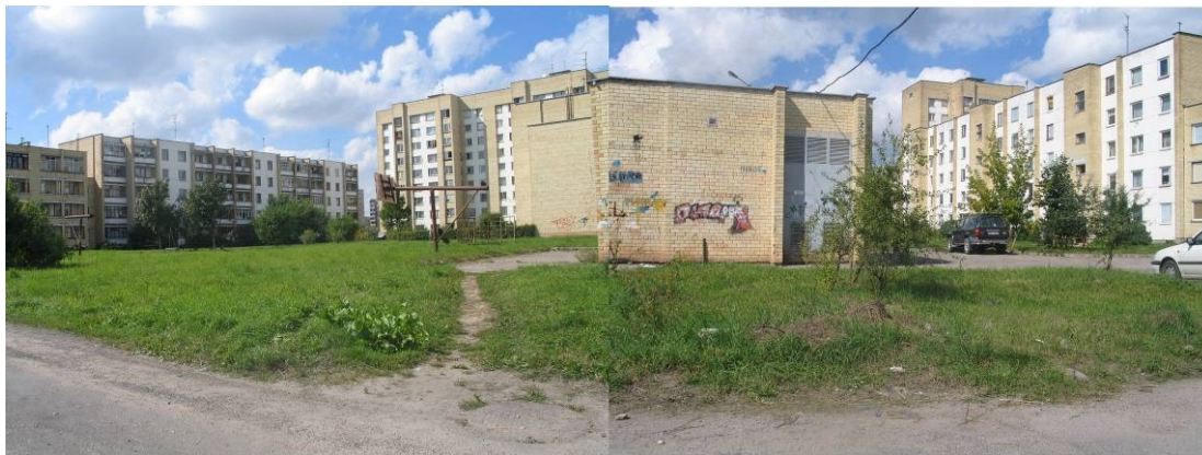
Pav. 33. Vietovės vaizdai iš Žaibo g. pusės.