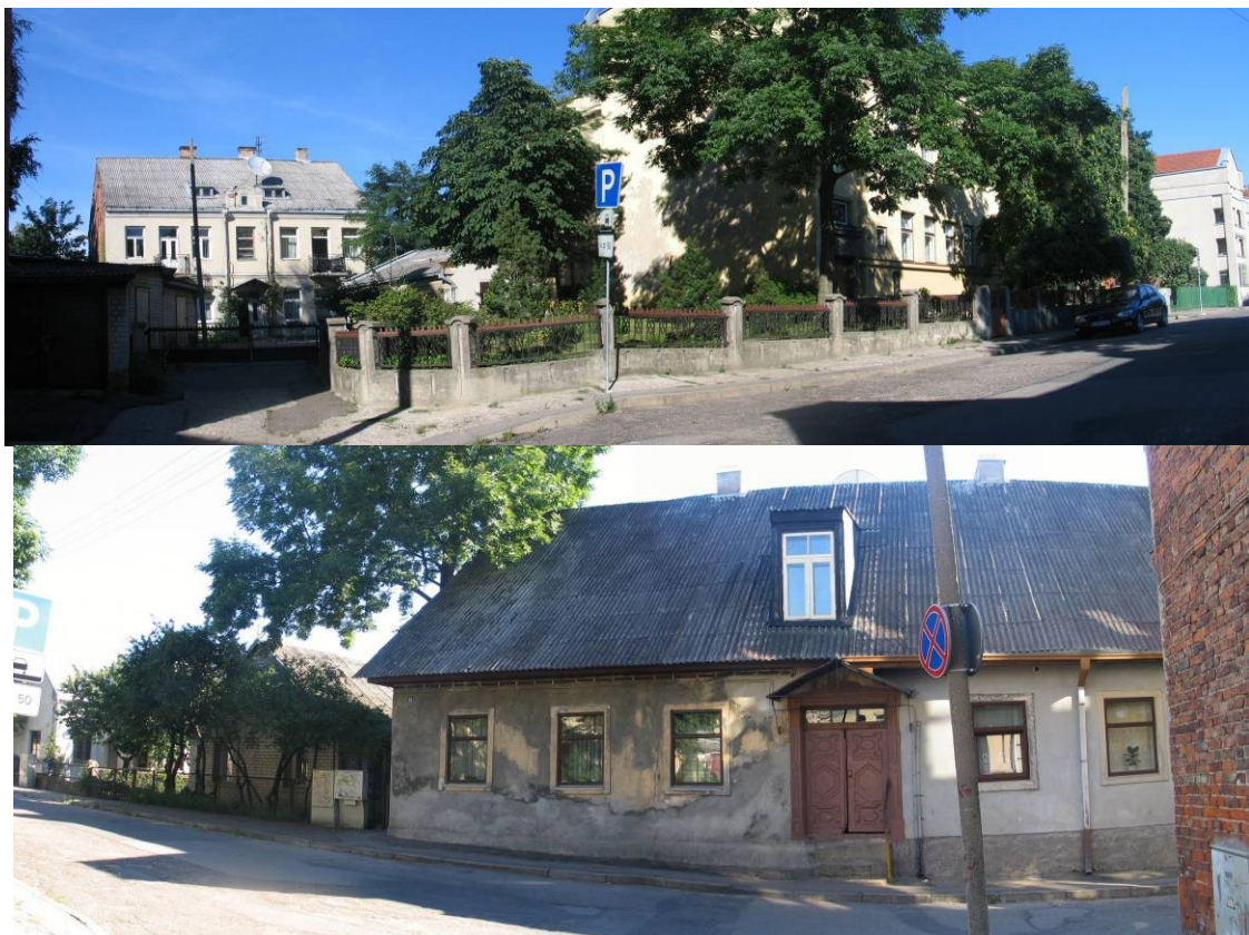
Pav. 16. Vaizdai iš D. Poškos g.

BP — tai sodybinio užstatymo gyvenamoji teritorija . Kauno miesto savivaldybės administracijos specialistų iniciatyva ją siūloma pakeisti į mažaaukščių gyvenamųjų namų statybos gyvenamąją teritoriją . Tačiau kai kurie šių sklypų ir pastatų savininkai gali prieštarauti pakeitimui, motyvuodami tuo, kad sodybinis užstatymas šioje vietovėje turi istorinę vertę.