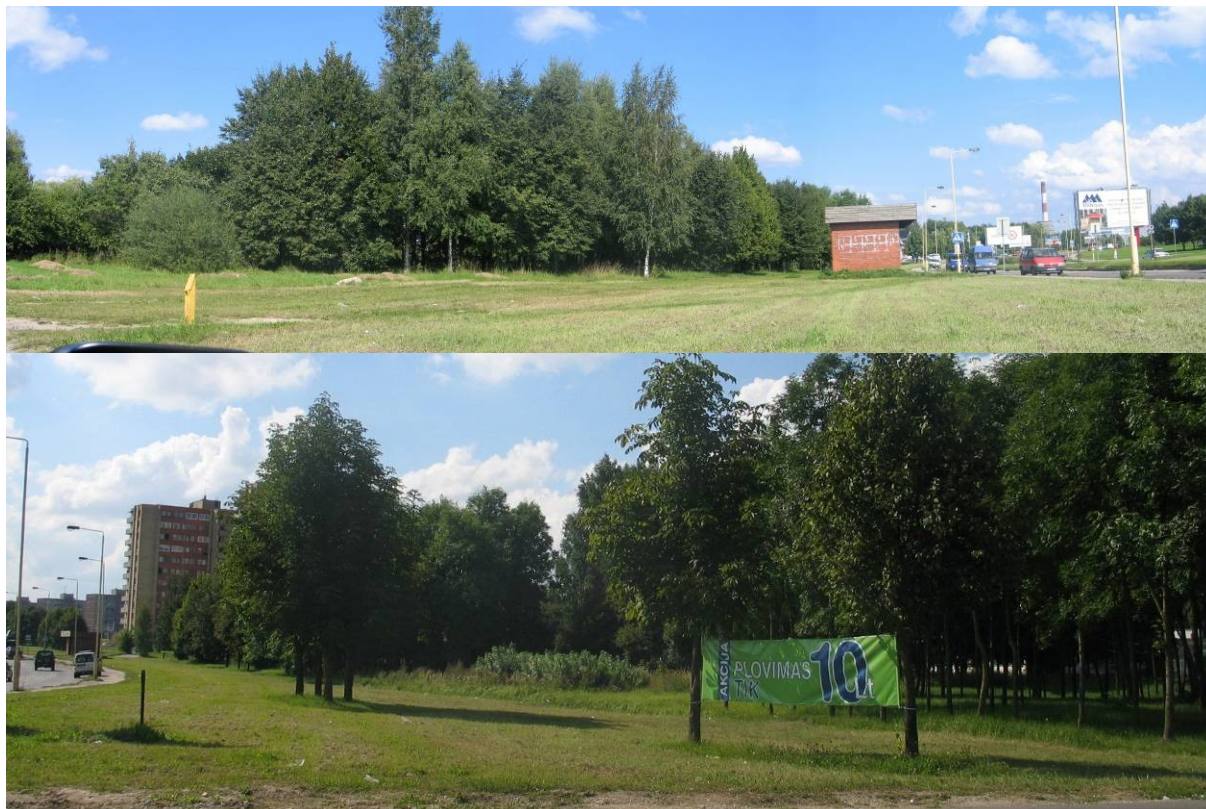
Pav. 4. Taikos pr. 125e, 125b, 125d, 127b vaizdas nuo prospekto pusės.

BP sprendinių keitimas šioje vietovėje neišvengiamai susijęs su tam tikros dalies želdinių panaikinimu bei žaliųjų plotų sumažėjimu. Šiam pakeitimui gali prieštarauti ir gretimų daugiabučių gyventojai. Tačiau žemė čia yra privati, ir jos savininkai siekia pasinaudoti teise gauti pelno iš savo nuosavybės.