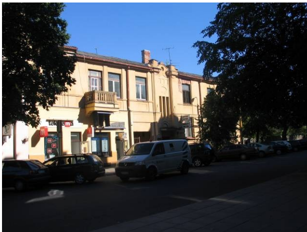
Pav. 20. I. Kanto 18 g. vaizdas.

Bendrajame plane šio sklypo paskirtis — gyvenamoji teritorija, sodybinio užstatymo , atsižvelgiant į realų užstatymo pobūdį, miesto savivaldybės administracijos specialistai siūlo pakeisti paskirtį į gyvenamąją teritoriją (mažaaukščių gyvenamųjų namų statybos) .