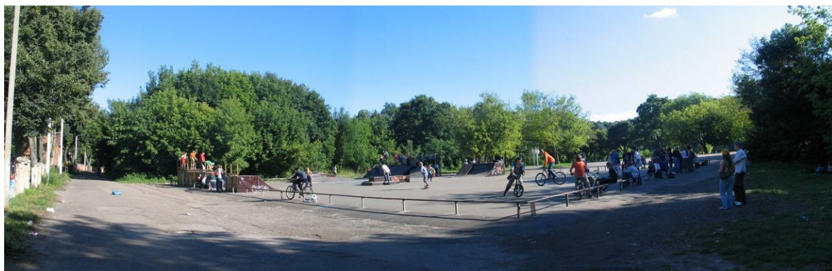
Pav. 18. Vietovės vaizdas iš Santakos g. pabaigos.

Šiai teritorijai taip pat yra 2004 m. parengtas detalusis planas. Pagal jį teritorija prie pat Bernardinų skg. yra gyvenamoji mažaaukščių statinių teritorija (nuotraukoje — tai medžiais ir krūmais apžėlusio teritorija), o asfaltuota aikštelė — infrastruktūros teritorija gatvių tinklui įrengti ir eksploatuoti. Pagal detalųjį planą, minėta infrastruktūros teritorija pirmiausiai skirta aptarnaujančiam transportui sustoti, kai vyksta masiniai renginiai Santakos parke. Šio detaliojo plano galijoto riba apima ir Priekplaukos krantinės gatvę, kuri yra pagrindinis įvažiavimas ir įėjimas į Santakos parką, tačiau atitinkamas servitutas čia nėra numatytas.