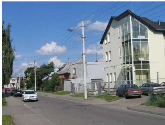
Pav. 32. Zarasų g. 38.

Vietovė yra Žaliakalnio rajone, Zarasų g. rytinėje pusėje, gyvenamajame kvartale. Tai nedidelis sklypas, kuris nepatenka į saugomas gamtines teritorijas bei nesiriboja su jomis, taip pat nėra kultūros paveldo vertybių ribose. Bendrajame plane — tai komercinės paskirties ir smulkaus verslo objektų teritorija . Pasiūlyta ją keisti į visuomeninės paskirties teritoriją .