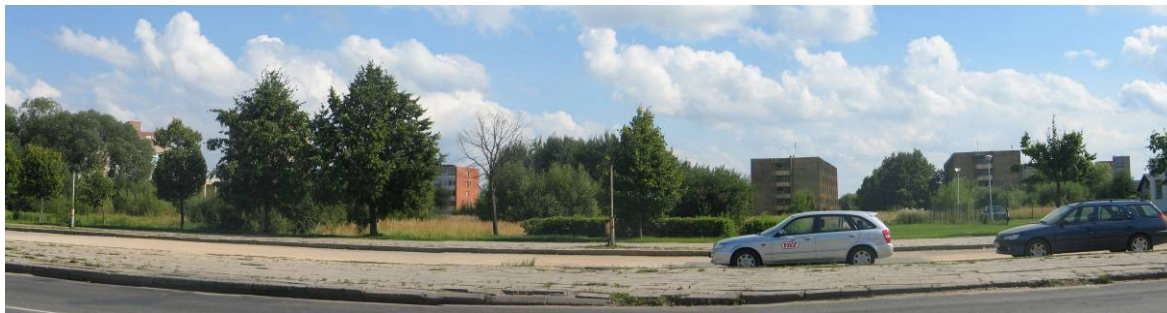
Pav. 35. Vaizdas į nagrinėjamos teritorijos pusę nuo Krėvės g.