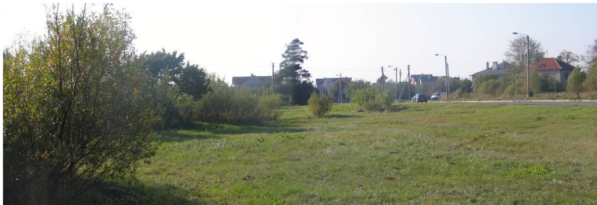
Pav. 11. Vietovės vaizdas nuo Kalvarijų g.

Pagal BP — tai gyvenamosios paskirties teritorija , o ją norima keisti į komercinės paskirties objektų teritoriją , (prekybos, pasaugų ir pramogų objektų statybos).